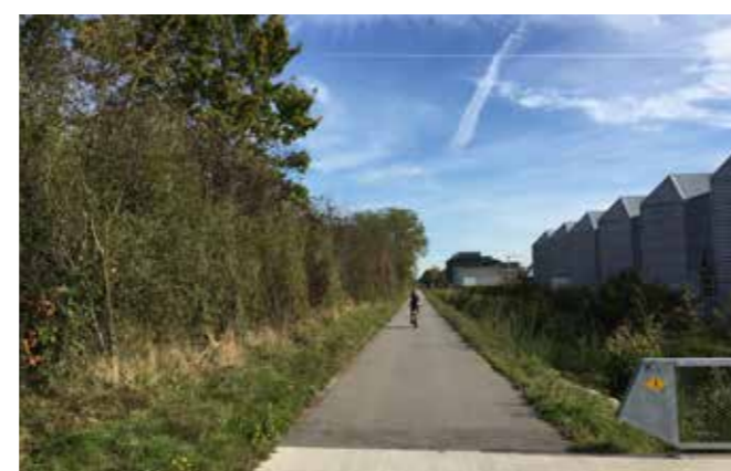
Satigny, le long du Nant-d'Avril