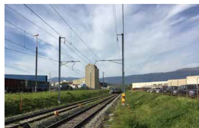
Meyrin, le long des voies ferrées